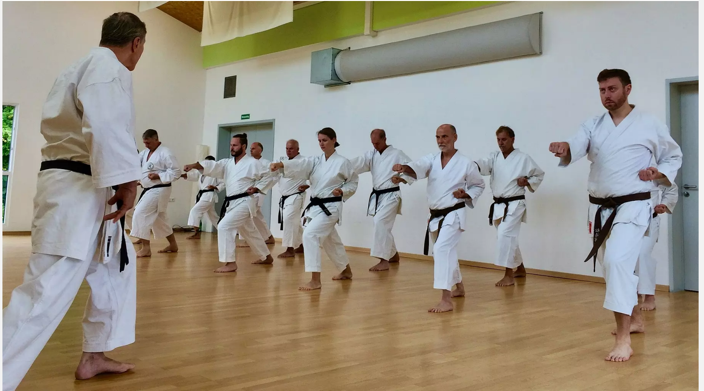
In Grafenrheinfeld wird unter dem Dach des TSV Grafenrheinfeld beim Dojo Haragei seit zehn Jahren Shotokan-Karate gelehrt.